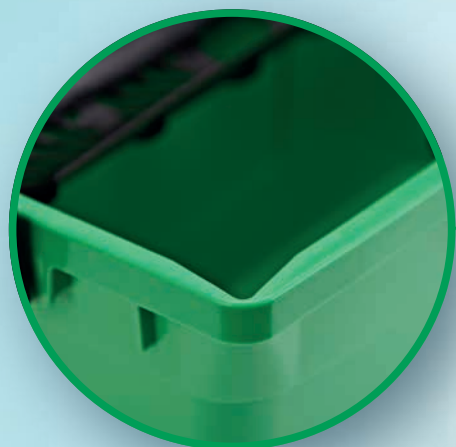
DEUX BECS VERSEURS