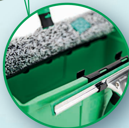
POSSIBILITÉS DE RANGEMENT FLEXIBLES POUR LES MOILLEURS ET LES RACLETTES JUSQU'À 35 CM