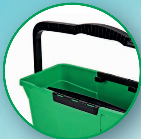
UNE ANSE ROBUSTE AVEC FIXATION VERTICALE

compacte offre suffisamment de place pour les ustensiles importants. Deux compartiments de rangement permettent de déposer le mouilleur et la raclette de vitre en toute sécurité. La nouvelle anse ergonomique avec fixation verticale est particulièrement pratique. Elle est maniable et se distingue par la possibilité de la positionner intelligemment et d'éviter qu'elle ne se rabatte involontairement.