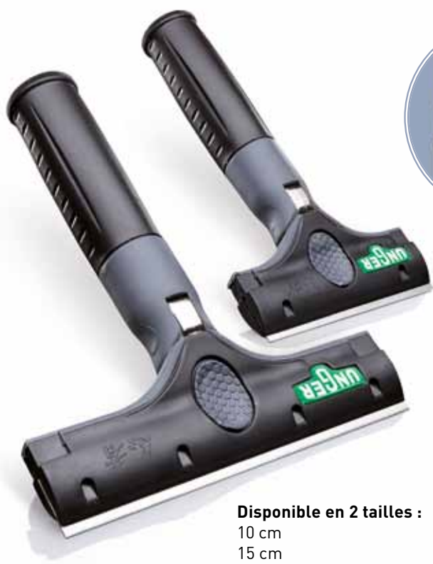
Disponible en 2 tailles : 10 cm 15 cm

0° et 30°. Avec support en caoutchouc pour le pouce afin d'avoir plus de pression, plus de prise, pour moins glisser et une meilleure manipulation. Ce système peut aussi être utilisé sur des perches télescopiques, et s'enclenche correctement sur le cône de sécurité Unger. Rapide, simple et sûr, il vous aide ainsi dans vos travaux de nettoyage des vitres.